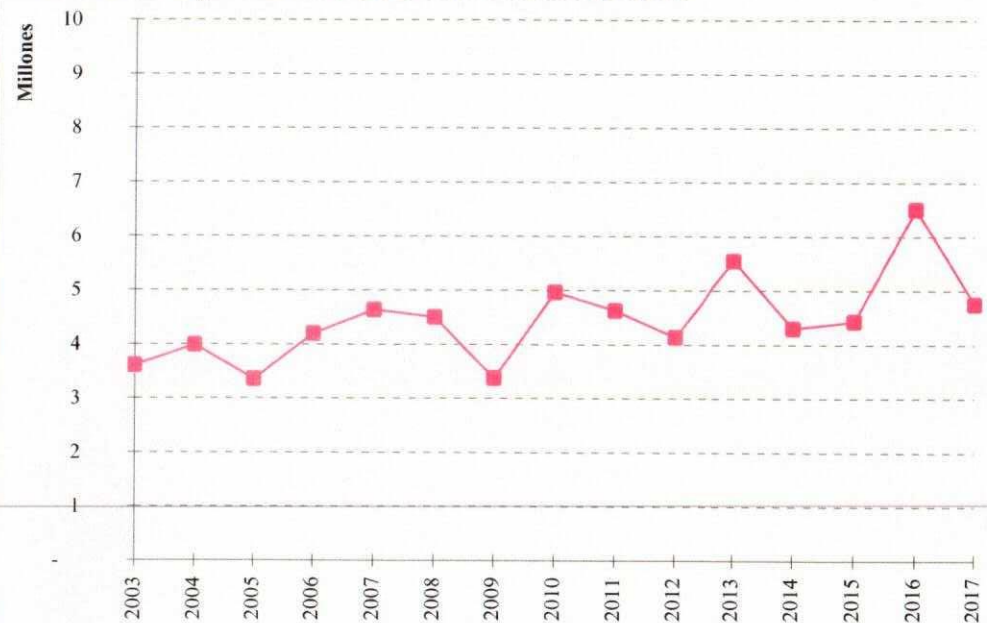
Evolución de la producción de uva variedad SAUVIGNON