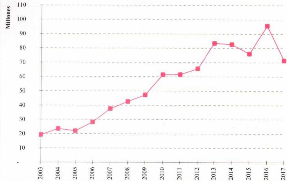
Evolución de la producción de uva variedad VERDEJO